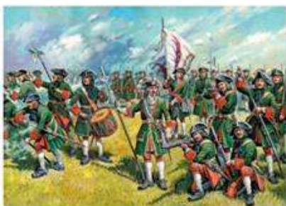
47 пехотных полков