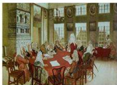
Создание Военной коллегии