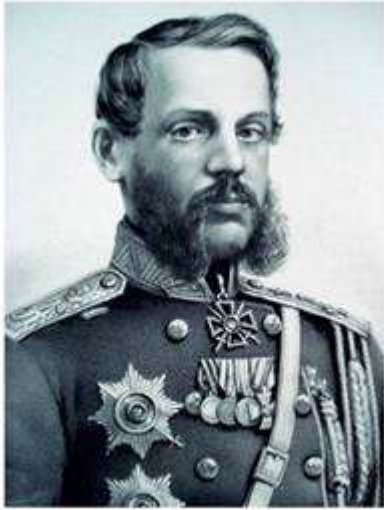
Дмитрий Алексеевич Милютин 1816—1912

С 1874 г. вместо рекрутских наборов была введена всеобщая воинская повинность: все мужчины, достигшие 21 года, призывались в армию.