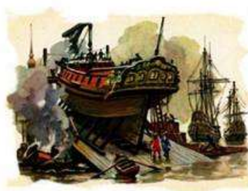
Создание Балтийского флота