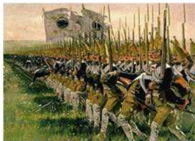
5 гренадерских полков